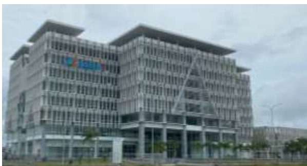
Gambar 1. Gedung Inalum, Kuala Tanjung

Sebagai proteksi dari bahaya kebakaran setiap bangunan dilengkapi dengan alat pemadam api ringan (APAR). APAR sangat efektif pada kondisi api yang masih kecil. Selain APAR, tentunya ada sistem deteksi dini bahaya kebakaran, seperti smoke detector ataupun jenis lainnya yang merupakan standar System Fire Alarm . Sebagai proteksi utama digunakan sistem firefighting yang menggunakan sprinkler dan hydrant box yang terpasang diseluruh gedung. Sistem firefighting didukung dengan sistem pompa hydrant . Pompa hydrant terdiri dari Pompa Jocky , Pompa Listrik dan Pompa Diesel. Gambar 2 adalah contoh pompa hydrant dalam gedung besar.