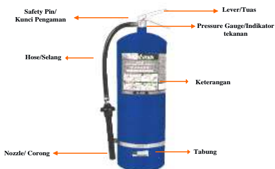
Gambar 7. Detail Tabung APAR

Jenis pemadam bahan kimia APAR ada bermacam-macam. Yang pertama adalah bubuk kimia kering atau dry chemical . Ini cocok untuk jenis kebakaran Jenis A. Material kedua adalah menggunakan gas karbon dioksida atau CO 2 . Jenis yang ketiga berupa busa atau foam . Beberapa jenis kebakaran menggunakan gas yang lebih lanjut seperti gas Halon. Penggunaan foam cocok untuk kebakaran jenis B yang berbahan cairan. Sementara untuk kebakaran listrik disarankan menggunakan pemadaman dengan gas. Bagian-bagian tabung diberikan pada Gambar 7.