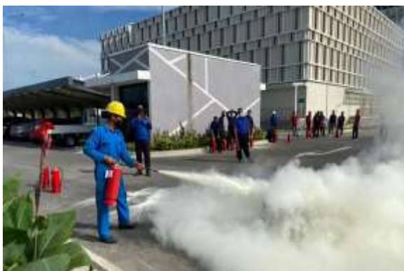
Gambar 10. Petugas gondola sedang memadamkan api dalam latihan

Pada Gambar 10 diberikan foto petugas gondola sedang memadamkan api menggunakan APAR.