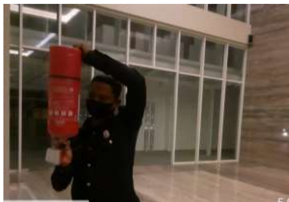
Gambar 8. Pemeriksaan APAR sambil dibalik tabungnya

Tabung APAR memiliki indikator tekanan. Selama tekananya masih memenuhi standar, maka APAR masih layak digunakan dan tidak perlu diisi ulang. Namun demikian beberapa perusahaan menetapkan pengantian isi tabung dilakukan secara berkala setiap tahunnya. APAR sebaiknya diperiksa setiap bulan satu sampai dua kali untuk menjaga fungsinya. Tabung dibalik saat dilakukan pemeriksaan untuk mencegah bubuk kimia mengeras. Gambar 8 adalah foto pemeriksaan APAR yang umum dilakukan oleh petugas.