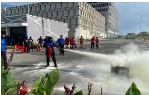
Gambar 11. Peserta perempuan sedang menggunakan APAR

Dalam pelatihan ini menggunakan jenis bubuk kering untuk memadamkan api. Peserta pelatihan terdiri dari 9 peserta perempuan dan 44 laki-laki. Dalam Gambar 11 diberikan foto petugas perempuan sedang menggunakan APAR.