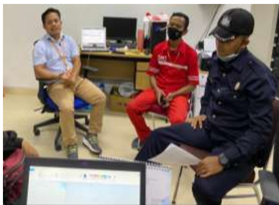
Gambar 4. Diskusi awal dengan Pengelola Gedung Inalum