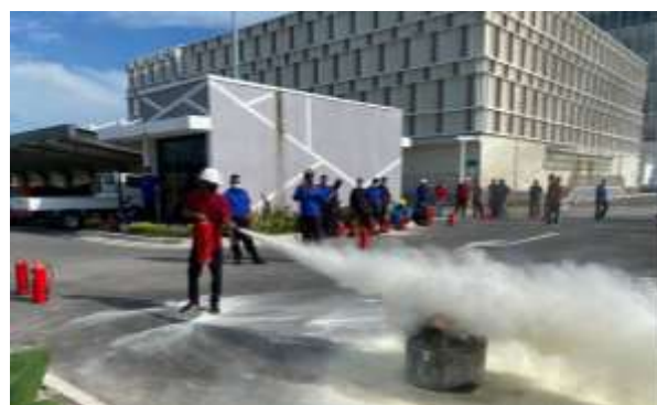
Gambar 9. Foto teknisi sedang memadamkan api dalam latihan

Pelaksanaan kegiatan dimulai dengan test awal dengan tujuan untuk mengukur pengetahuan peserta dalam hal APAR. Peserta dikumpulkan dalam lapangan terbuka untuk penjelasan oleh Tim Pelatih. Sebelum dimulai, seluru pesertadi briefing dan diberikan arahan. Dalam proses pelatihan, arah angin sering berubah arah. Peserta wajib menyesuaikan arah angin. Ini bertujuan untuk menghindari radiasi panas dan keracunan asap. Gambar 9 adalah foto teknisi sedang memadamkan api menggunakan APAR.