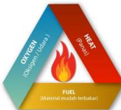
Gambar 6. Unsur teori segitiga api

Dalam pelatihan ini diberikan materi sebagai pembekalan awal. Materi yang disampaikan berupa teori api dan segitiga api. Api bisa terjadi bila 3 unsur pendukungnya terpenuhi yaitu udara, bahan bakar dan panas yang cukup. Teori ini sering dikenal dengan segitiga api. Teori segitiga api diberikan pada Gambar 6.