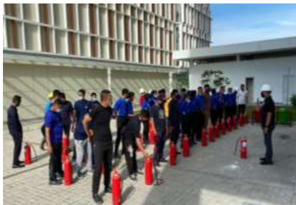
Gambar 5. Proses persiapan pelatihan