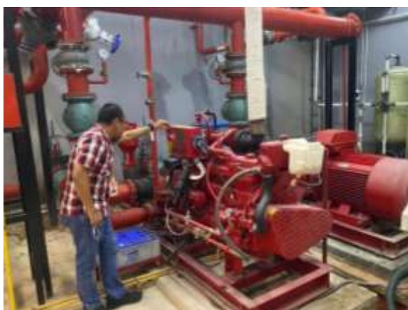
Gambar 2. Contoh pompa hydrant dalam gedung

Sebagai proteksi dari bahaya kebakaran setiap bangunan dilengkapi dengan alat pemadam api ringan (APAR). APAR sangat efektif pada kondisi api yang masih kecil. Selain APAR, tentunya ada sistem deteksi dini bahaya kebakaran, seperti smoke detector ataupun jenis lainnya yang merupakan standar System Fire Alarm . Sebagai proteksi utama digunakan sistem firefighting yang menggunakan sprinkler dan hydrant box yang terpasang diseluruh gedung. Sistem firefighting didukung dengan sistem pompa hydrant . Pompa hydrant terdiri dari Pompa Jocky , Pompa Listrik dan Pompa Diesel. Gambar 2 adalah contoh pompa hydrant dalam gedung besar.